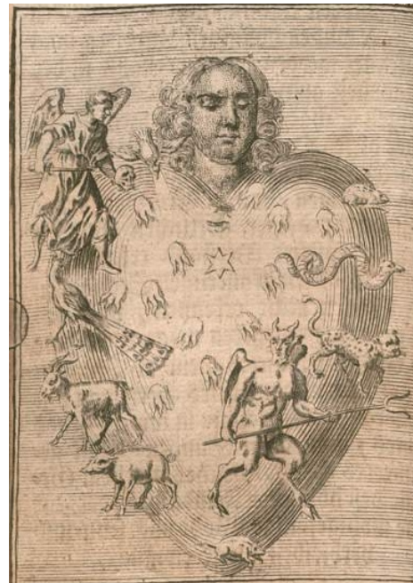
Johann Salver, Geistlicher Seelen-Spiegel, Würzburg 1733

Mit Blick auf die Gegenwart wollen wir erwägen, wie sich die reformatorische Anthropologie heute fassen lässt, in welchen Phänomenen der Gegenwartskultur sich Spuren einer solchen Sicht auf den Menschen entdecken lassen und wie sich nicht zuletzt Rechtfertigung vor dem Hintergrund solcher Phänomene neu verständlich machen ließe.